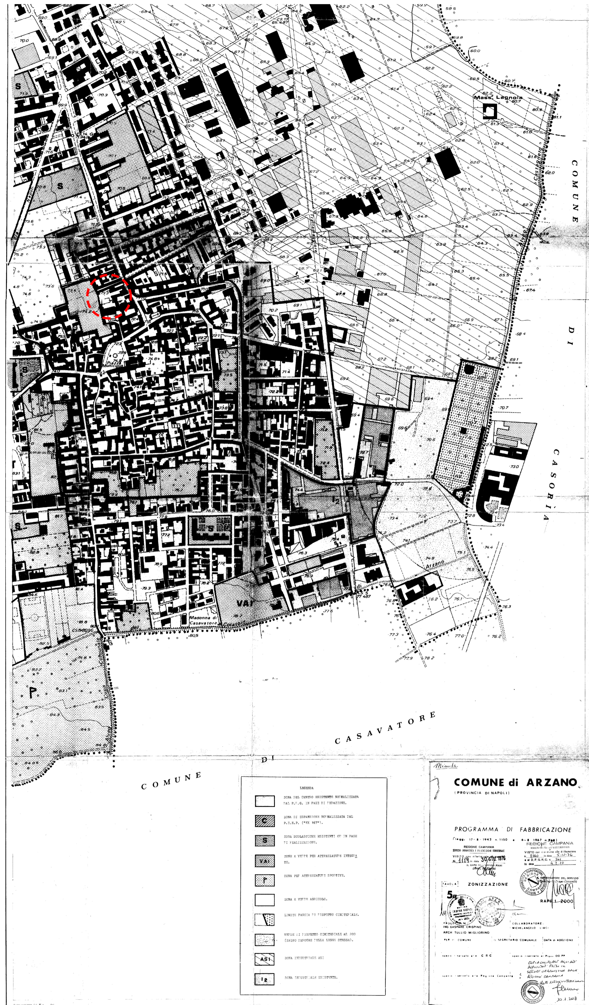
Stralcio Piano di Fabbricazione